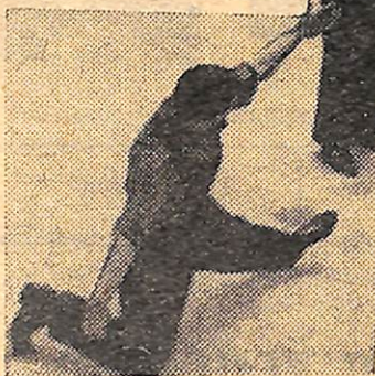
Так заканчивается танец строителей в исполнении самодеятельного хореографического коллектива.

6 МАРТА СОСТОЯЛОСЬ ТОРЖЕСТВЕННОЕ ОТКРЫТИЕ ДВОРЦА КУЛЬТУРЫ «ОКТЯБРЬ»